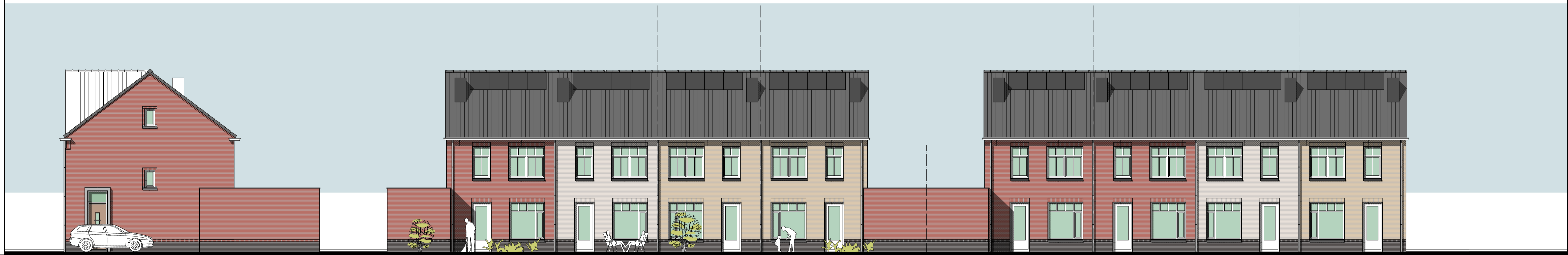
KAVEL 155 ZIJGEVEL optionele garage optionele garage KAVEL 155 ACHTERGEVEL KAVEL 154 KAVEL 153 KAVEL 152 optionele garage optionele garage KAVEL 151 KAVEL 150 KAVEL 149 KAVEL 148 ACHTERGEVEL