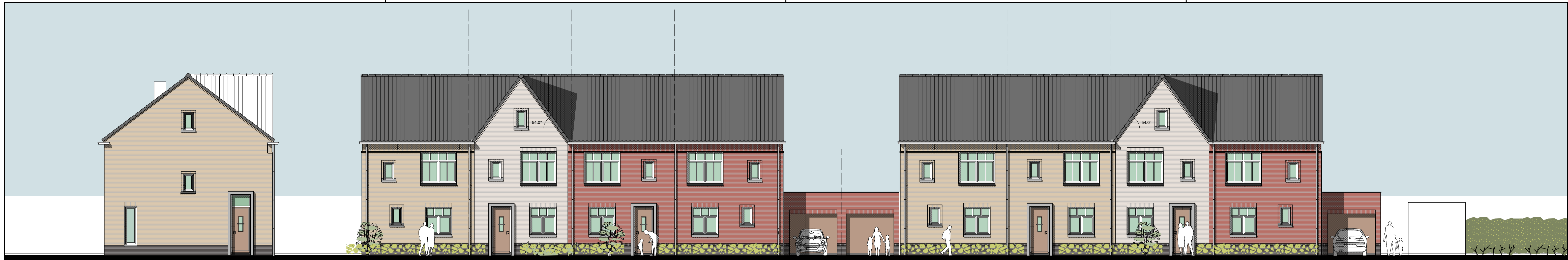
KAVEL 148 ZIJGEVEL KAVEL 148 VOORGEVEL KAVEL 149 KAVEL 150 KAVEL 151 optionele garage optionele garage KAVEL 152 KAVEL 153 KAVEL 154 KAVEL 155 VOORGEVEL optionele garage